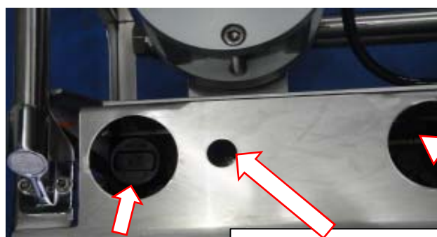
レギュレーターハンドル バルブ・テスターのボタン 潤滑油ゲージ